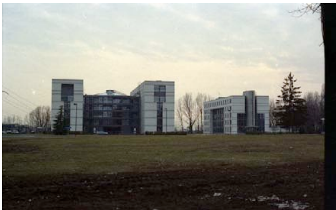
Le CERN est situé à cheval entre la France et la Suisse.

Son interpellation est intervenue après une surveillance électronique prolongée. Le 9 novembre 2010, lors d'une audience devant la Cour de Cassation, les conditions qui ont présidé à son arrestation ont été détaillées. Dans son arrêt, la Cour confirme le rejet des requêtes en nullité de la garde à vue déposées devant la chambre de l'instruction, une position très courante dans les affaires terroristes. Les magistrats écrivent :